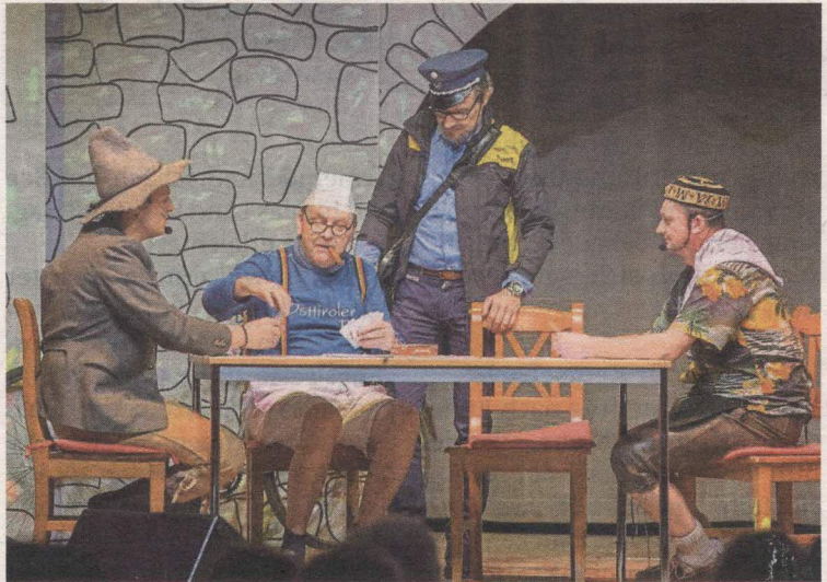
Ein buntes, abwechslungsreiches Programm bieten die Burgrichter zu Gurnitz ab Freitag