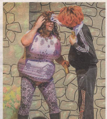
Jessas, wie anstrengend – das gilt auch für die Proben

Bei der diesjährigen Premiere ist übrigens etwas anders als sonst. Nusser: „Es ist das erste Mal, dass die Burgrichter zu Gurnitz nun in völlig erneueter Formation auftreten. Aus der alten Garde ist heuer erstmals niemand mehr dabei.“ Nachwuchsprobleme haben die Gurnitzer Narren jedoch nicht: „Wir haben nun einige junge neue Leute im Team, die sich sehr engagieren und sich einbringen. Wir können höchst zufrieden sein und hoffen, dass das so weiter geht“, sagt Nusser. Auch heuer wird der Verein mit