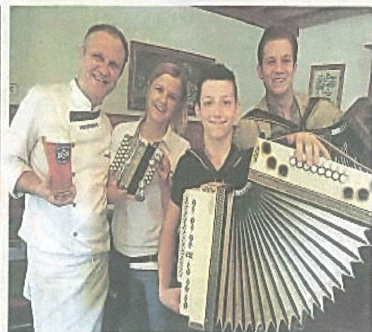
Im Gasthaus Hartl in Neuhaus wurde musiziert